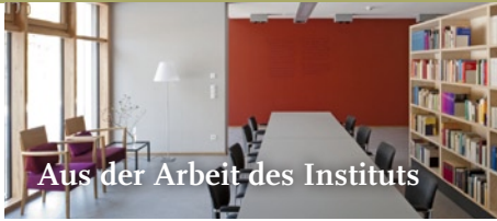
Aus der Arbeit des Instituts