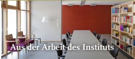
Aus der Arbeit des Instituts