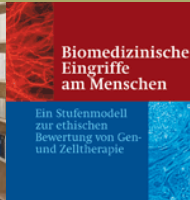
Biomedizinische Eingriffe am Menschen

Ein Stufenmodell zur ethischen Bewertung von Gen- und Zelltherapie